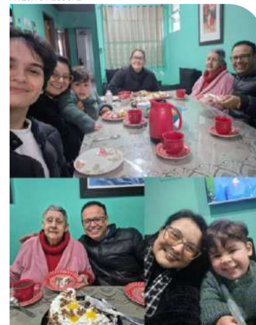
Um fraterno abraço aos queridos leitores e amigos da família Hyppolito Garcia.