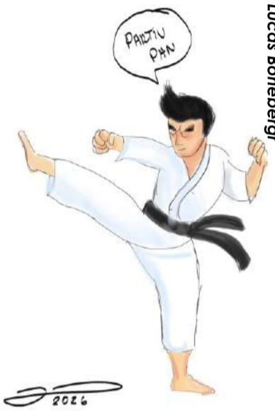
por Lucas Boneberg