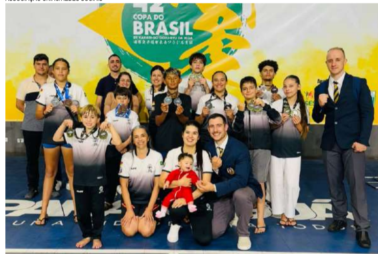
ASSOCIAÇÃO UNIÃO/REDES SOCIAIS

A cidade tem muito a celebrar e a ver desses atletas.