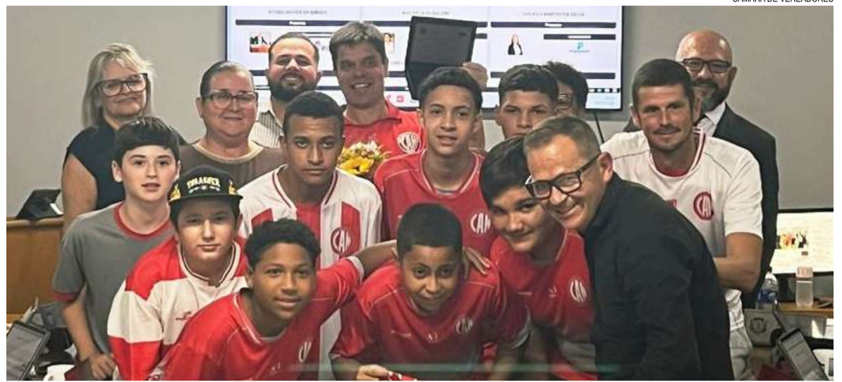
CÂMARA DE VEREADORES