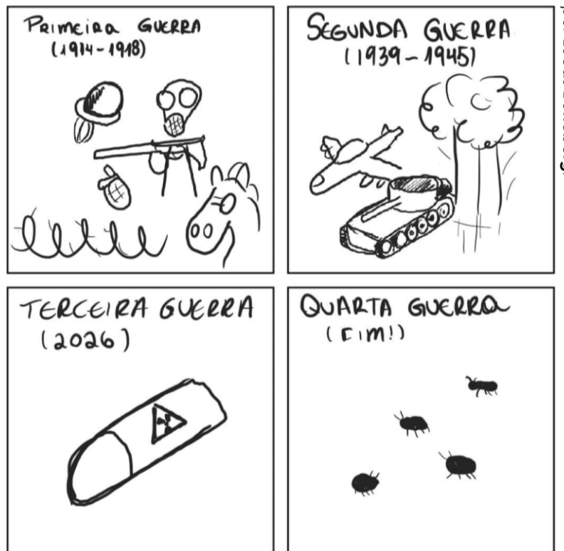
por Lucas Boneberg