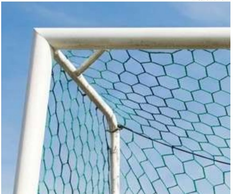
IMAGEM CRIADA POR IA

Ainda no sábado, o estádio Florêncio Py receberá a rodada inaugural da categoria Master da Copa Verão. A partir das 13h45, Itapuí e Medianeira fazem o primeiro confronto do dia. Logo depois, Sans Souci e MG 100 completam a rodada.