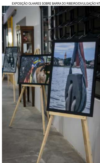
EXPOSIÇÃO OLHARES SOBRE BARRA DO RIBEIRO