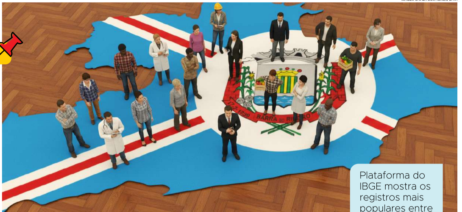
IMAGEM CRIADA COM AUXÍLIO DA IA

O Instituto Brasileiro de Geografia e Estatística (IBGE) divulgou na última terça-feira, dia 4 de novembro, uma nova plataforma digital reunindo os nomes e, pela primeira vez, também os sobrenomes mais comuns do país, com base nos dados do Censo Demográfico de 2022. O levantamento permite filtrar as informações por estado ou município, revelando curiosidades e padrões que ajudam a contar a história de cada lugar e, no caso de Barra do Ribeiro, o resultado mostra um retrato fiel da identidade local.