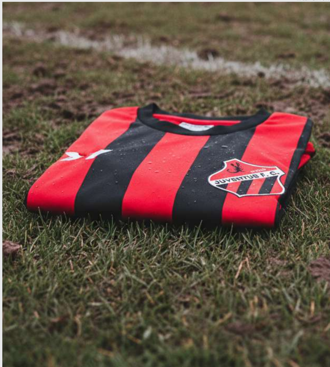
IMAGEM FEITA POR IA