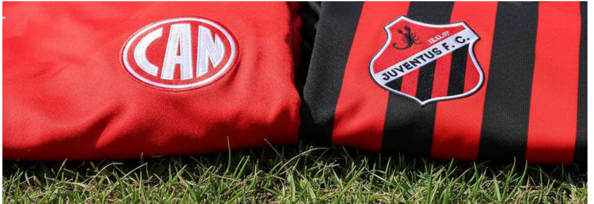
IMAGEM FEITA POR IA