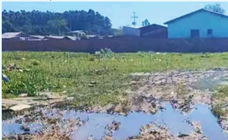
IMAGEM ANEXADA À PROPOSIÇÃO

- Este pedido nasce a partir das manifestações da comunidade, que vê na travessia uma ligação fundamental para o bairro e, principalmente, para o trajeto dos estudantes da Escola Fernando Hoff. É uma medida necessária para garantir a segurança, trafegabilidade e bem-estar da população.