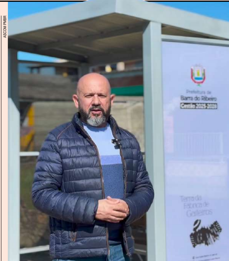
Prefeito durante a entrega da nova parada de ônibus

O reforço financeiro permitirá à APAE manter e ampliar seus serviços, garantindo a continuidade do atendimento de qualidade às pessoas com deficiência intelectual e múltipla no município, reafirmando o compromisso da Prefeitura com a inclusão e o bem-estar da comunidade.