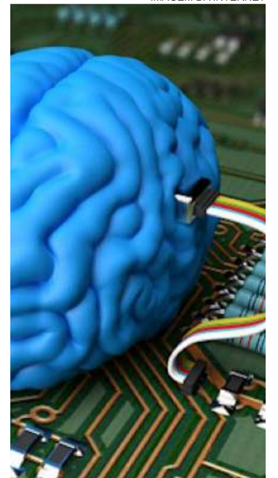
IMAGEM DA INTERNET

que estão os arquivos da vida. Porque é ali que está o computador de Deus que abre a porta, que abre o caminho de sua passagem neste mundo. Boa sorte e felicidades a todos.