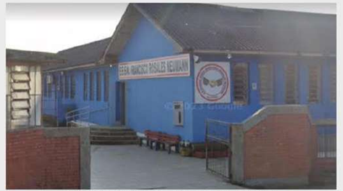
E.E.M Francisco Rosales Neumann

A Escola Francisco Rosales Neumann segue inovando suas atividades! Agora, contamos com um jornal digital: o Diário do Chico .